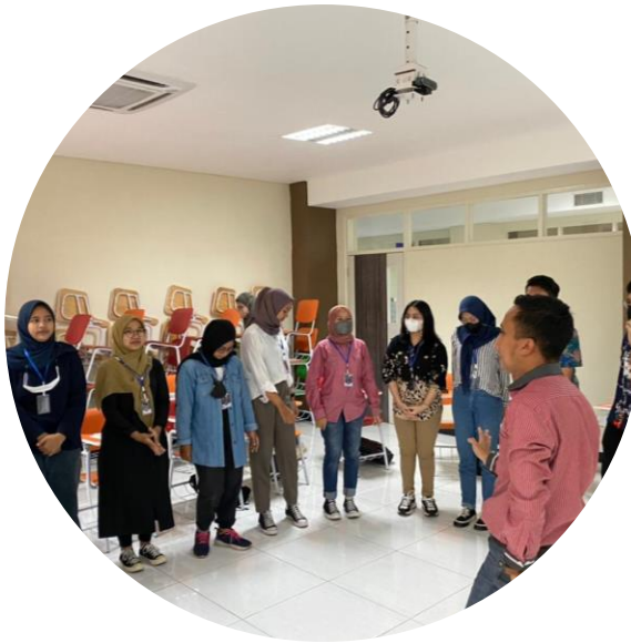
Kelas Industri (Pembekalan)